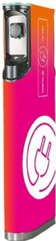
Rys.1 Przykładowa stacja ładowania o mocy 22 kW ładowania ING – Tauron Polska Energia S.A. [media.tauron.pl]

Okolice budynków użyteczności publicznej. Teatry, kina, baseny – to przykłady miejsc, dla których z dużym prawdopodobieństwem można określić godzinę zakończenia wykonywanej aktywności. Kierowca pozostawi pojazd do ładowania na zaplanowany, określony czas. Podobne lokalizacje, dla których przynajmniej w pewnym zakresie można regulować czas trwania aktywności, to cmentarze, banki, urzędy, salony fryzjerskie, centra miast itp. Office parki. Pomimo, że lokalizacja przeznaczona jest przede wszystkim dla pracowników i gości firm, punkt ładowania może być udostępniany publicznie wtedy, kiedy nie jest użytkowany, lub w określonych przedziałach czasowych w ciągu doby.